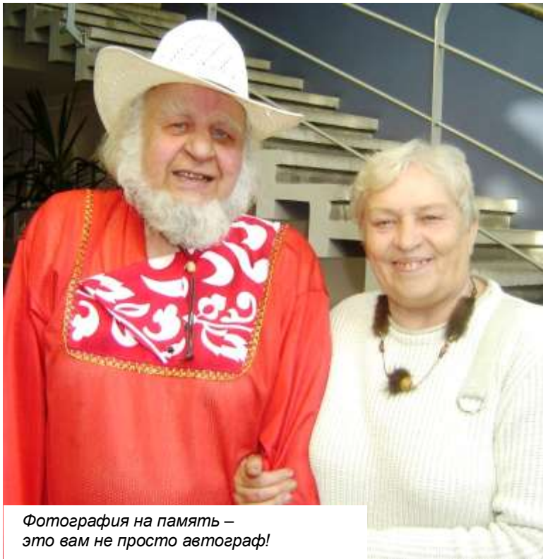
Фотография на память – это вам не просто автограф!

- Надо подумать! - довольно серьёзно отвечает мой собеседник.