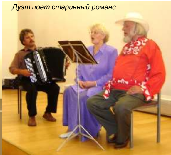
Дуэт поет старинный романс