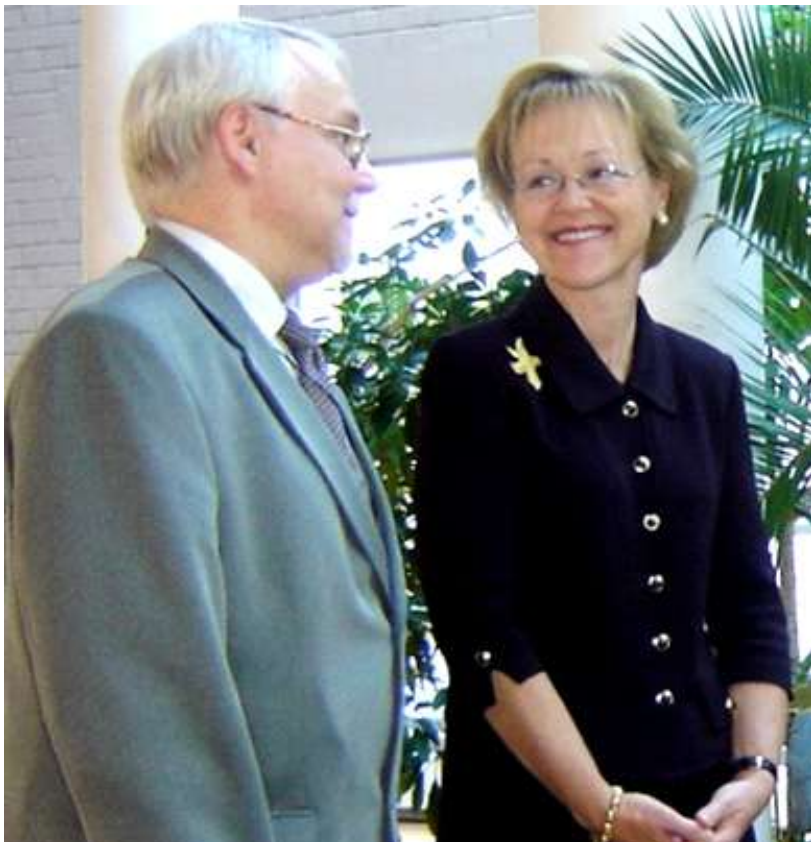
Посол США Алдона Вос на открытии выставки