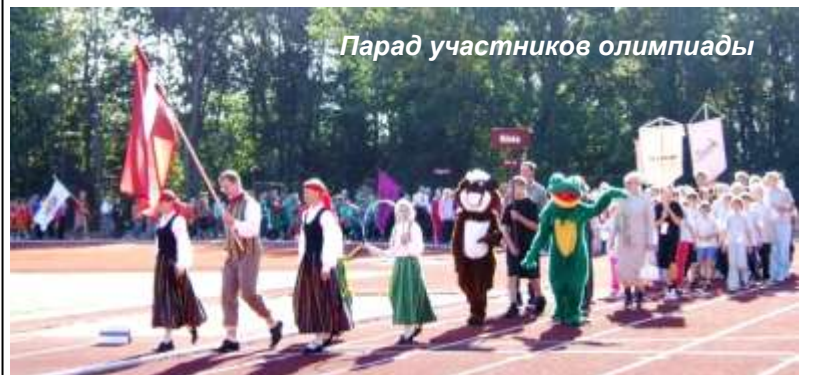
Парад участников олимпиады

15-16 сентября в Валке прошла молодежная Олимпиада Валкского района.