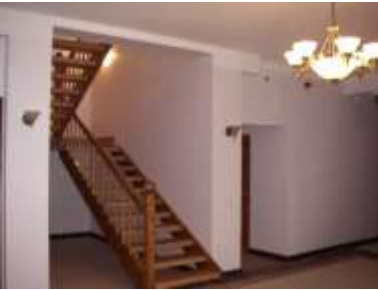
В холле ратуши теперь гораздо больше места