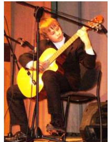
Играет Хенри Тэдер

Как и раньше, будут устраивать в школе концерты известных и начинающих музыкантов. 27 октября ожидается выступление нового камерного ансамбля Зиемеллатвии из Валки.