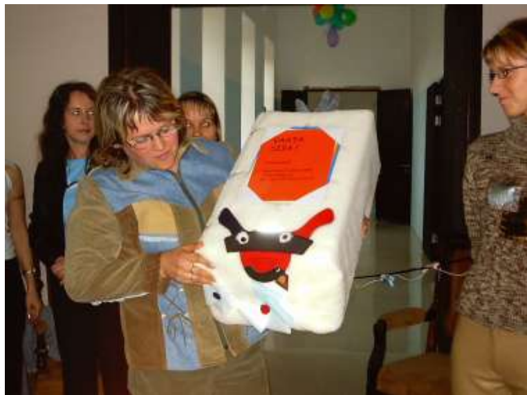
На новоселье всегда приятно получать подарки

Финляндию и Швецию. Налажены связи с Норвегией, но туда пока еще товар не отправляется. В Россию поставки ведутся, но через Финляндию. Партнеры бывают разные. Случается, что приходится разрывать отношения с теми, кто неаккуратно выплачивает деньги за товар. Из Финляндии привозят сырье, чертежи моделей. Раз в году предприятие делает бесплатно сандалии для всех своих работников. Если остаются лишние заготовки - подошва, принимаются заказы.