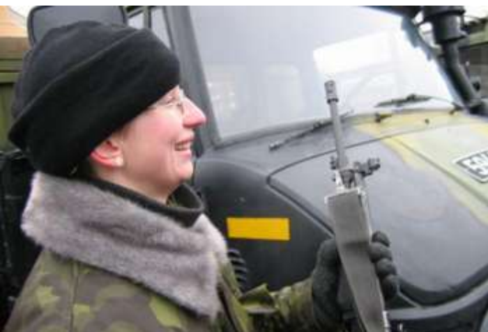
На фото одна из участниц парада - ополченка Кайтселийт.

Гражданин Евгений Криштафович обратился к главнокомандующему Сил Обороны Эстонии вице-адмиралу Тармо Кыутсу, потребовав от него начать расследование по факту распространяющегося в интернете фотоснимка, на котором запечатлена женщина в форме Сил Обороны Эстонии, в правом ухе которой находится серьга в форме свастики.