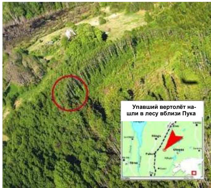
Упавший вертолёт нашли в лесу вблизи Пукка