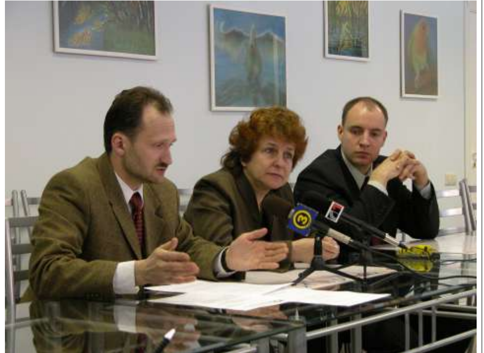
Первая тройка кандидатов в Европарламент от ЗаПЧЕЛ (слева направо): Мирослав Митрофанов (второй в списке), Татьяна Жданок (номер 1) и Юрий Соколовский (номер 3)!