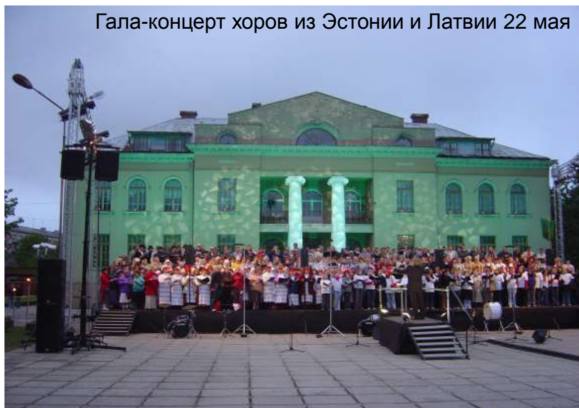
Гала-концерт хоров из Эстонии и Латвии 22 мая