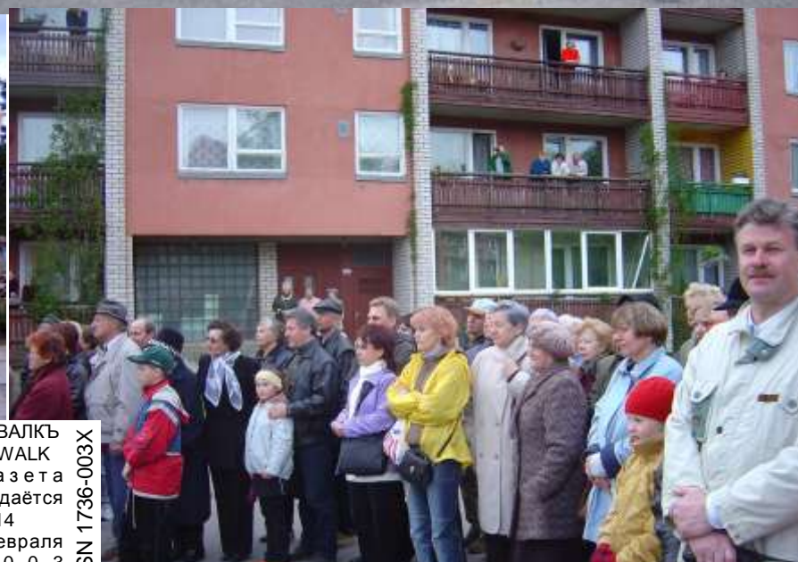
Многие зрители следили за праздником из окон своих квартир