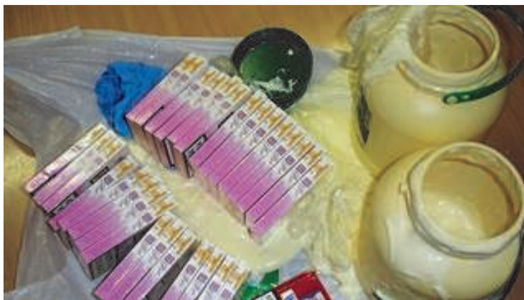
Сигареты пытались провести в банках с майонезом.

5 декабря сотрудники Налогово-таможенного департамента обнаружили 13 000 сигарет,