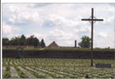
Мемориал Холокоста около лагеря для военнопленных в городе Терезин (Чехия)