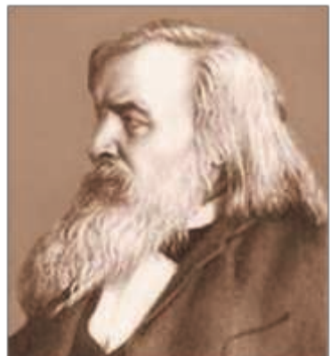
Менделеев Дмитрий Иванович

Событие, послужившее причиной неформальному установлению Дня рождения водки, произошло 31 января 1865 года. В этот день в Петербурге Дмитрий Иванович Менделеев защитил свою знаменитую докторскую диссертацию - «О соединении спирта с водою» - над которой работал в 1863-64 годах. Диссертация хранится в