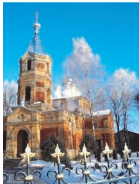
Православный храм в Валге посвящён святому Исидору

В праздник Крещения прихожане (72 человека) и батюшка Исидор вышли зимой на замёрзшую реку прорубать лёд для водосвятия. Там их схватили иноверцы, посадили в ратушную тюрьму, всё время заставляя отречься от веры. Ночью мученики причастились запасными Святыми Дарами, а утром их судили на ратушной площади. Право-