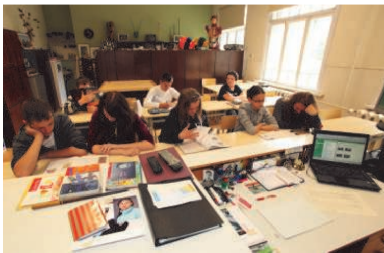
Последний урок в кабинете биохимии.