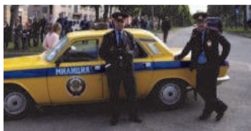
Порядок на прошлом параде поддерживает милиция

Анне Везсаар читает отрывки из книг писателей Валгамаа по Радио Руут