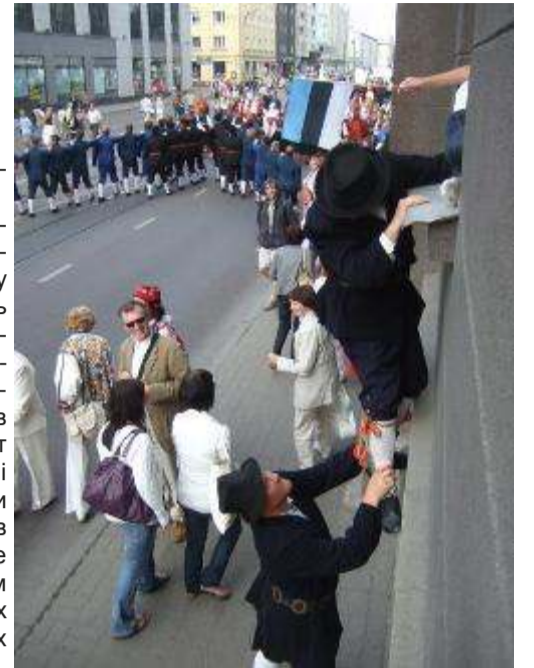
"Да здравствуют зрители на окнах!" - кричали нам участники парада и даже ловко взбирались на подоконники, награждая нас поцелуями и шоколадом

В этот раз мне улыбнулась удача – случай дал возможность полюбоваться на праздничное шествие из окон первого этажа дома на Нарвском шоссе. Лучшей "ложи" и пожелать было невозможно. Это подтверждал и тот факт, что в этом же здании, чуть выше, расположилась со своей аппаратурой телеоператоры ETV. В результате, на экране работающего в комнате телевизора, мы видели то же самое, что и в окне. Но из окна "трансляция" шла без перебоев, и было видно разом несравнимо больше. Выбравшись на подоконник, я имела огромное преимущество перед телезрителями – полный обзор всего Нарвского шоссе в его оба конца. На нем, просто яблоку было негде упасть. Уже за полчаса до начала парада зрители выстроились по обе стороны шоссе, и когда на нем появились первые колонны, улица заполнилась людьми от площади Виру до Таллиннского университета. Такое зрелище у любого выбьет слезу умиления и родит гордость за страну, к которой сам принадлежишь. Я искренне прочувствовала эту гордость. Это моя земля. На ней я родилась. Ее море, Старый Таллинн, национальный костюм и песни – моя первая и последняя любовь. Ее я зову и признаю единственной родиной. ... Она часть меня, и я – часть ее. Ее музыкальным язы-