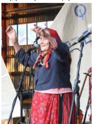
Поёт Вирве Кёснер

Весь этот вечер берег праздничный огонь почетный караул, а народ, под музыку духового оркестра из Аудру и ансамбля «Пярнуские парни» («Pärnu poisid»), веселился-плясал до поздней ночи. Знаменитая на всю Эстонию Вирве с острова Кихну, в свои 81 год исполнила так звонко и задорно несколько своих песен, что у всех на лицах расцвели улыбки и захотелось пуститься в пляс. После концерта, я поспешила взять интервью у парашютистки – на свое 80-летие (8 июня 2009) Вирве Кеснер прыгнула с парашютом! Она же, никогда не учившаяся ни вокалу, ни музыке, известна на всю Эстонию как автор многочисленных и сегодня очень популярных фольклорных песен, исполняемых по всей Эстонии. Всем знакомы слова и мелодия красивой песни о море «Meie rüü» (Праздник моря): «Mei õn, mei jääb, mei olema reab...» (Море есть, море будет, море всегда должно быть...).