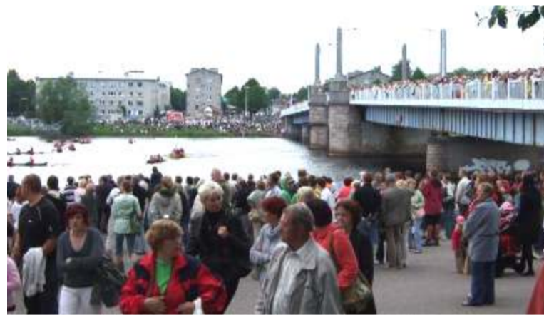
Весь город Пярну собрался на реке

порта превратились в этот вечер в импровизированный амфитеатр, заполненный до отказа зрителями. С трудом, протиснувшись на середину моста, я с полчаса искала, не освободится ли местечко поближе к перилам, откуда станет возможным заснять на фотокамеру происходящее.