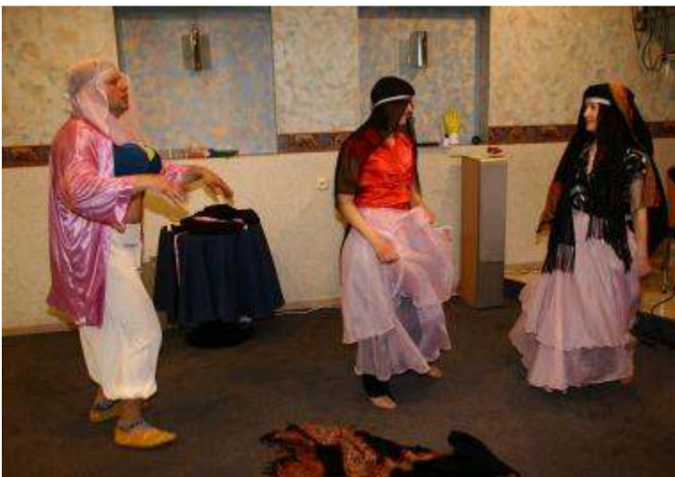
Дамы с Востока