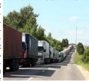
На КПП "Убылинка"

рассказали ИА REGNUM Новости в группе общественных связей Пограничного управления ФСБ России по Псковской области, анализ ситуации показал, что причиной резкого увеличения трансграничных пешеходов стало подорожание сигарет и алкоголя в Эстонии и Латвии. "Подорожание сигарет и алкогольной продукции в Эстонии и Латвии способствовало резкому увеличению количества лиц, занимающихся их вывозом из России. Количество лиц, пересекающих границу в пешем порядке, увеличилось в несколько раз, как в сравнении с аналогичным периодом прошлого года, так и в целом. Так, в международном автомобильном пункте пропуска (МАПП) службы в городе Печоры (граница с Эстонией) пассажиропоток увеличился в среднем в четыре раза, в МАПП службы в городе Пыталово (граница с Латвией) - в среднем в 10 раз", - рассказали в группе общественных связей.