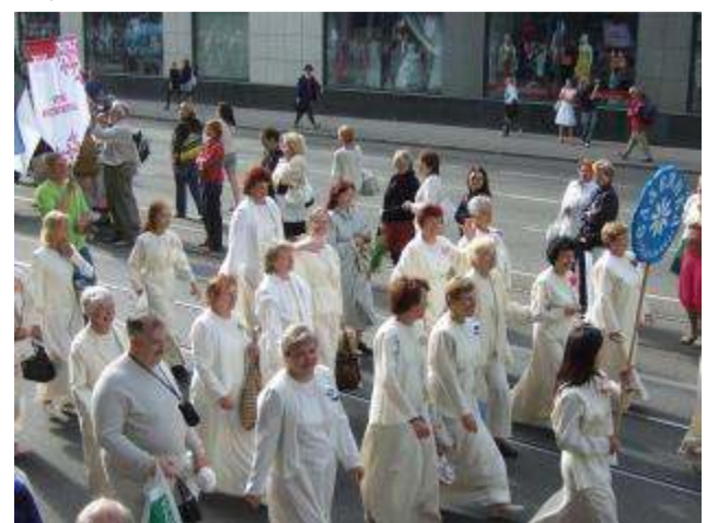
Русская хоровая капелла "Славянка"