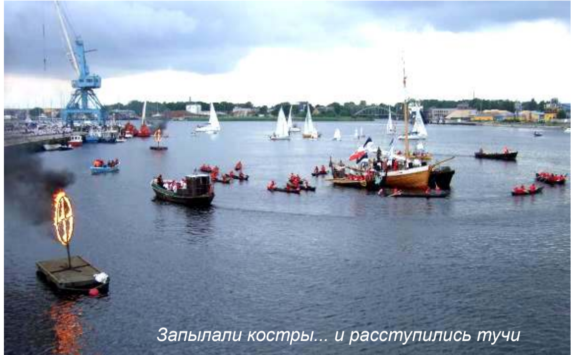
Запылали костры... и расступились тучи

Подойдя вечером 27 июня к центральному мосту в Пярну, в первый момент, я испугалась – выдержит ли мост... Казалось, одна его сторона разместила на себе все население города, пришедшее посмотреть на «Церемонию прибытия огня». Несмотря на хмурое небо, нависшие свинцовые тучи и очень холодный ветер, оба берега реки возле городского моста и