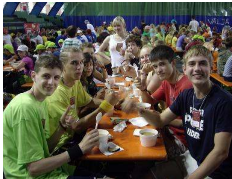
Долгожданный обед после многочасовой репетиции

Поразительна работоспособность танцевальных коллективов: от маленьких учеников 3-4 классов до опытных исполнителей в возрасте сеньоров — все самоотверженно преодолевали трудности, тренировались и радостно выступали. Каждый из восьми тысяч танцоров заслужил, чтобы перед ним сняли шляпу.