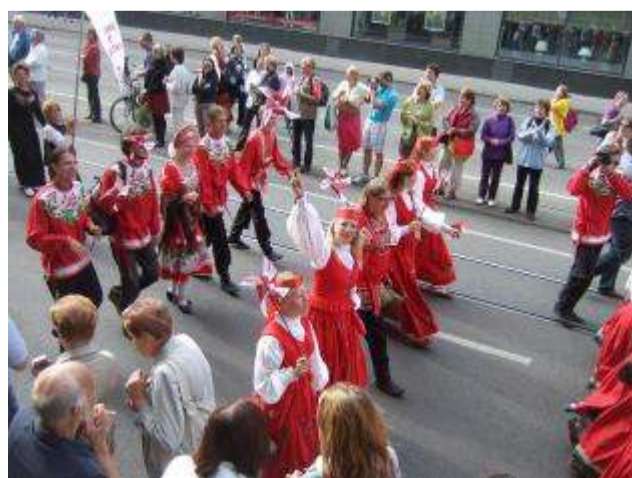
В русских народных костюмах - Ласнамяэская русская гимназия;