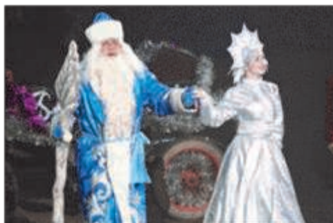
Дед Мороз и Снегурочка - главные фигуры этого праздника

В этот день почитали противника Перуна — Мороза — ипостась Велеса. Можно сказать, что Мороз — зимняя ипостась Велеса, так же, как Яр (сын Велеса и Дивы) — весенняя.