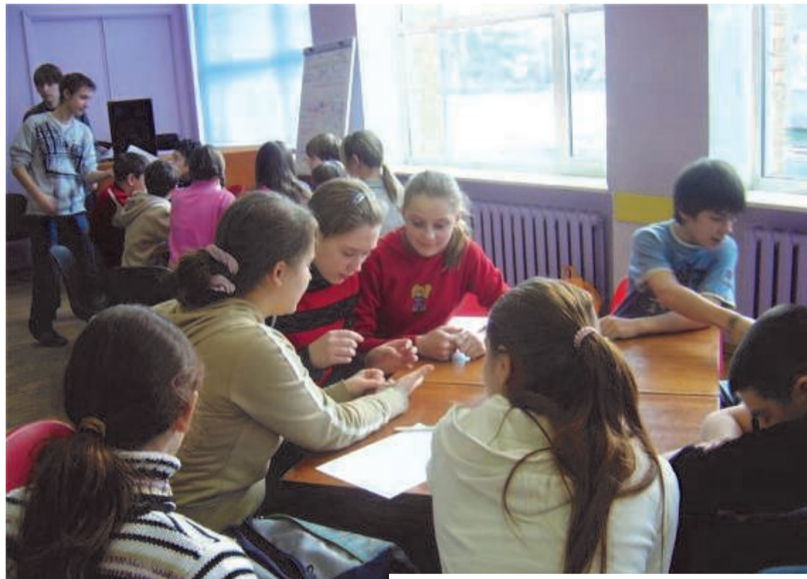
Участники конкурса знатоков эстонского языка

С появлением в городе дискотек существование ученического кооператива потеряло свой смысл. Народу стало ходить мало. Ведь в стенах школы дискотеки заканчивались раньше 22.00, а алкогольные напитки полностью запрещены.