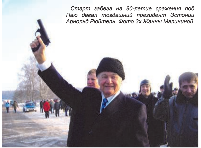
Старт забега на 80-летие сражения под Паю давал тогдашний президент Эстонии Арнольд Рюйтель.

Уже в шестнадцатый раз проводится Паюский забег, в котором могут принять участие все желающие.