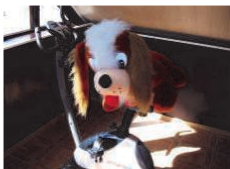
Ручная мойка машин в Валга Куперьянови, 101b, 53004146

ТРУДНОСТИ С КОМПЬЮТЕРОМ? Поставь себе русский Windows! Перевод системы на русский, украинский, эстонский, латышский, финский и другие языки. Антивирусы, обновления. +372 5663 4269 Объявление не стареет!