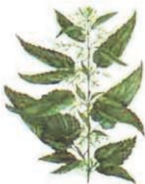
Крапива двудомная Urtica dioica L.

Использовать для заправки супов и в качестве приправы к мясным и рыбным блюдам.