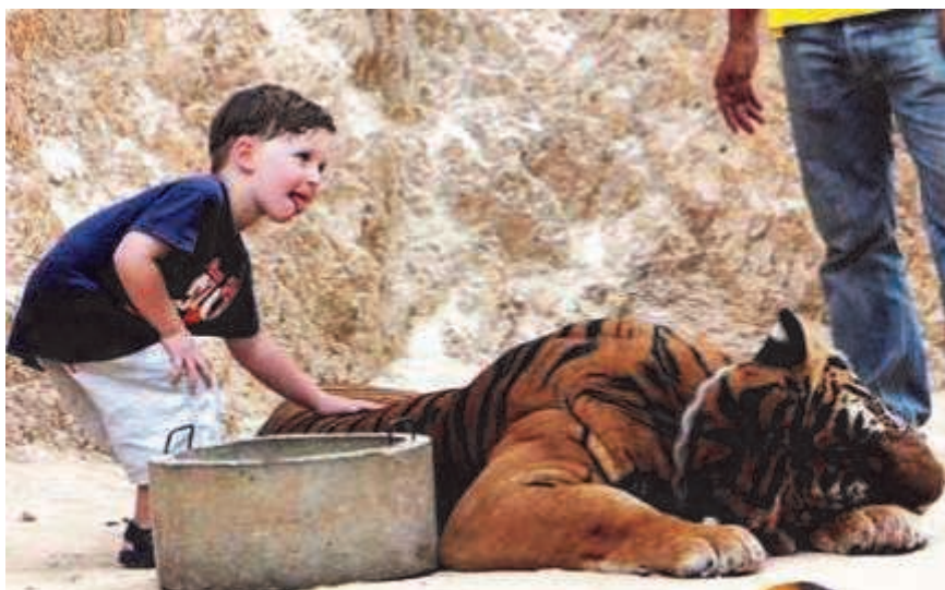
Тигров приводят в скалистый каньон, где они греются на солнышке и позируют фотографам.

Туристы в Таиланде могут посетить Храм тигров (по-тайски: Ват Па Луангта Буа Яннамсампанно). Там монахи в оранжевых одеждах находят общий язык с этими прекрасными хищниками, кормят их, заботятся, играют и даже пускают к ним туристов. Конечно, предвительно «кошечек» кормят.