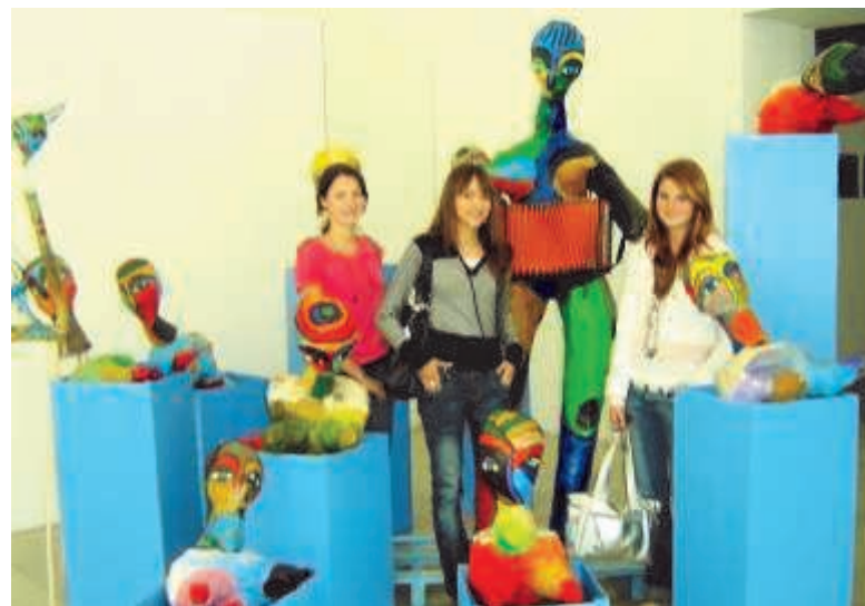
Настоящие юные красавицы и «красавицы», созданные фантазией художника, в зале «Женщина»

Так называются выставки в музеях нового искусства. Здесь читатели могут увидеть некоторые произведения из пярнуской экспозиции.