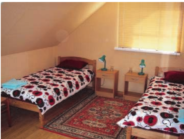
Уютные комнаты для отдыха