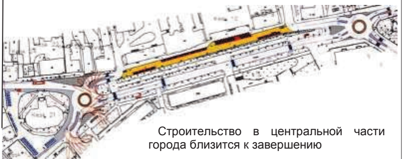
Строительство в центральной части города близится к завершению