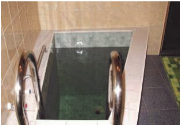
Бассейн и баня ждут посетителей

Магазин «LUMHELVES» Кунгла 4, Валга Предлагаем кондиционеры. Цены начиная с 6500.-