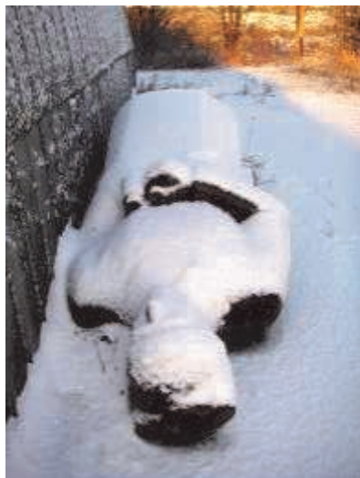
Много лет памятник пролежал за бывшим асфальтовым заводом.

Теперь он будет лежать на лужайке за бывшим замком Орловых в Таллинне, где расположен Эстонский исторический музей и где к настоящему времени собрано 15 советских памятников разного типа.