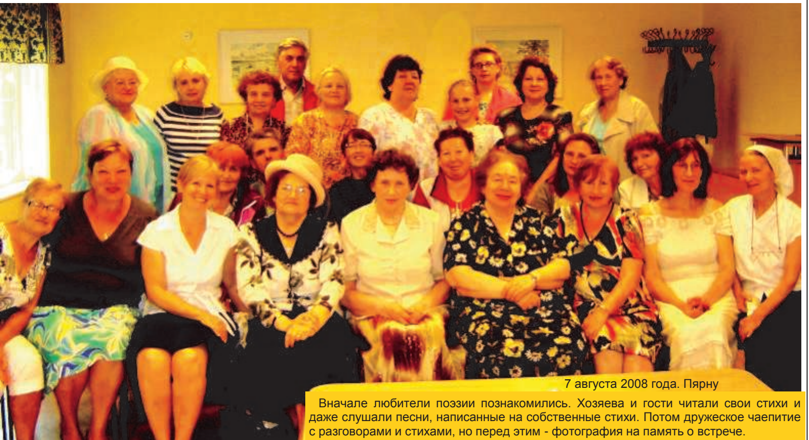
7 августа 2008 года. Пярну

Будем ждать новых встреч! Спасибо за гостеприимство!