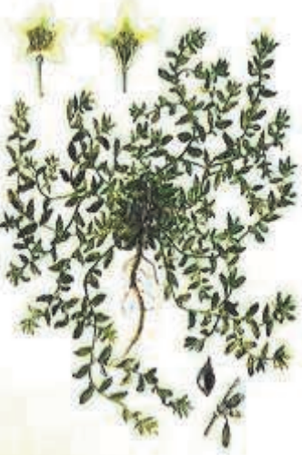
Спорыш - горец птичий Polygonum aviculare

Спорыш - горец птичий. Polygonum aviculare