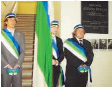
Почетный караул у мемориальной доски