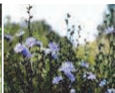
Cichorium intybus (цикорий обыкновенный)