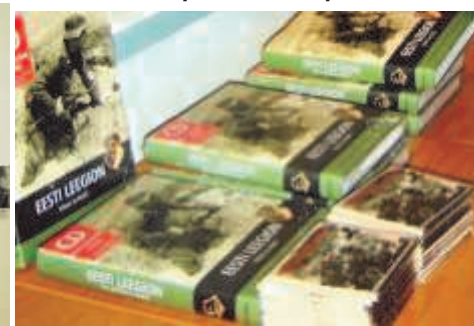
Участникам конференции были предложены книги и аудиоматериалы об Эстонском легионе СС

12 июня Март Лаар представил свой новый труд о бойцах Эстонского легиона, входившего в состав германского подразделения Ваффен-СС в годы Второй мировой войны.