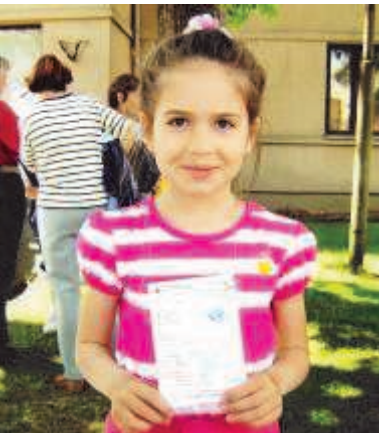
Надо пройти через все пункты