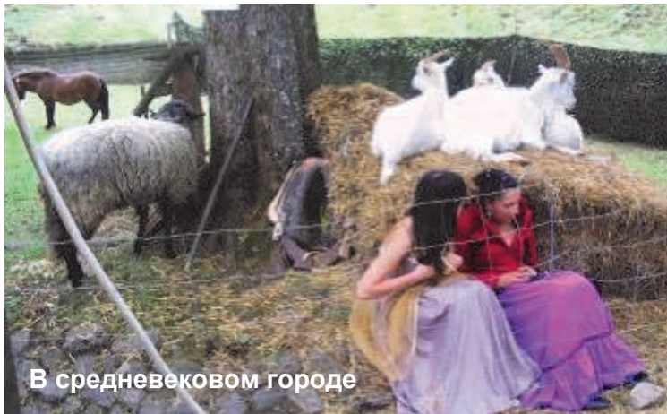
В средневековом городе

"Помимо активной торговли национальными эстонскими товарами, в эти дни в городе