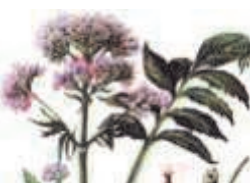
Valeriana officinalis (валериана лекарственная)