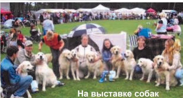
На выставке собак