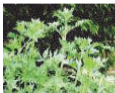
Artemisia absinthium (полынь горькая)