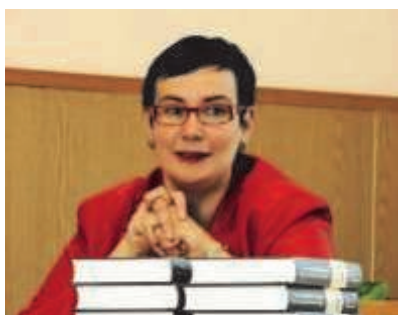
Вице-канцлер Министерства образования и науки Катри Райк

Поправки к Закону о языке не требуют пересдачи экзаменов от имеющих справки старого образца. Переход на новые категории будет плавным и справедливым.