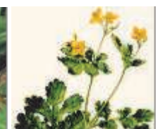
Chelidonium majus (чистотел большой)