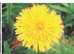
Taraxacum officinale (одуванчик лекарственный)