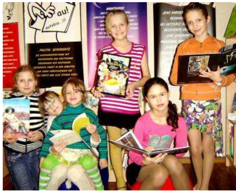
Маленькие читательницы с книгами комиксов