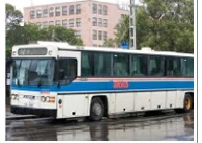
программу распределения дотаций.

В настоящее время министерство анализирует все договоры с уездными перевозчиками, чтобы не позднее марта предложить новую