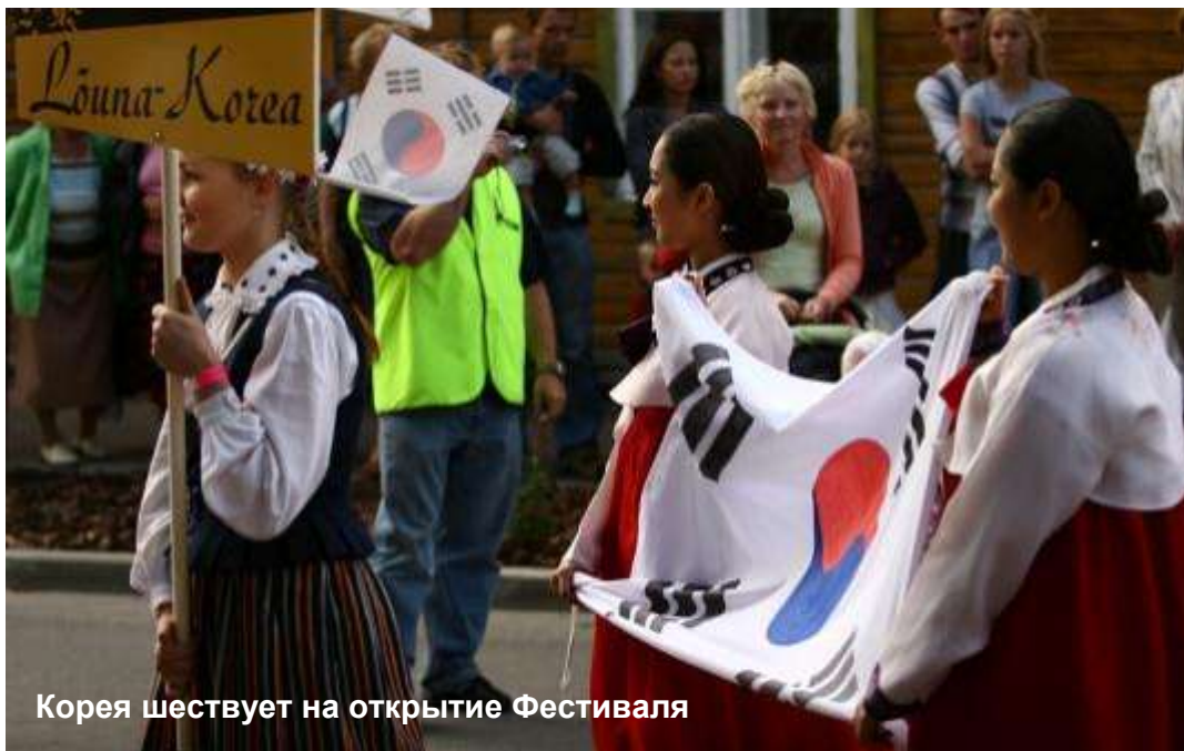
Корея шествует на открытие Фестиваля

Народное творчество, песни и тан- цы в национальных костюмах, игра на народных инструментах групп из Венгрии, Польши, Норвегии, Украи-