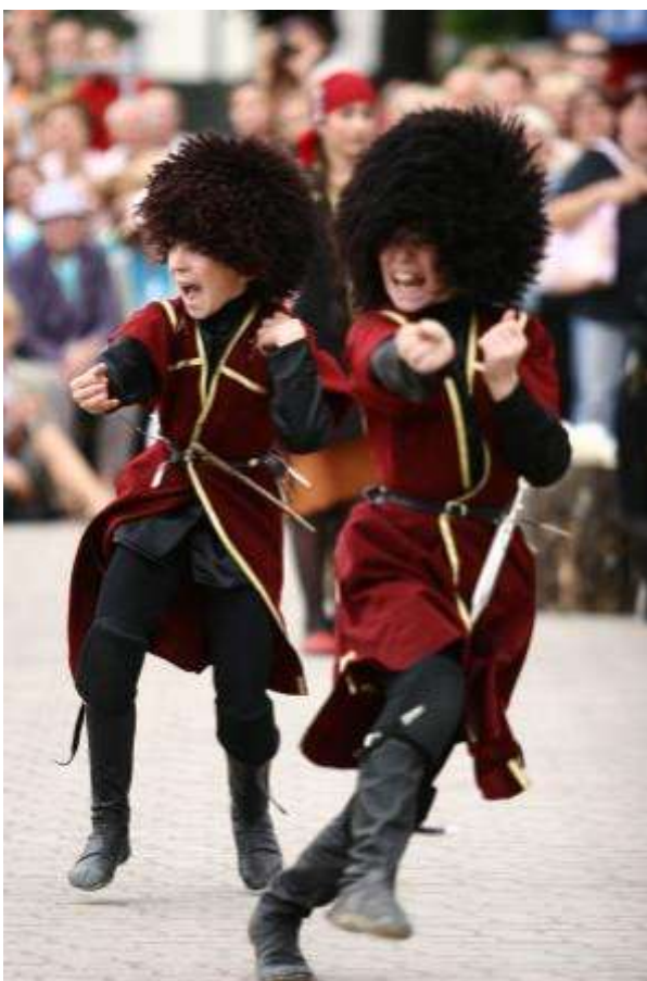
Зажигательные грузинские танцы Ансамбль «Болнели»

ны увлекали людей своим открове- нием и чистотой исполнения. Особенно запомнятся зрителям экстр- вагантные ирландки, за- жигательные и отважные ребя- та ансамбля народного танца из Грузии «Болнели» (Bolneli), которые только что успели покорить Таллин и Валга, экспрессивные костариканцы, колоритные чер- кески из Израиля. Конечно же, не могли оставить никого равно- душными темпераментные ита- льянцы с Сицилии «Лантерна» (Lanterna) и «Сан Паоло» (San Paolo).