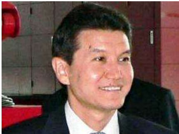
Президент ФИДЕ Кирсан Илюмжинов

Международная шахматная федерация (ФИДЕ) построит в столицах 165 стран, входящих в эту организацию, шахматные центры и отели в виде шахматных фигур.