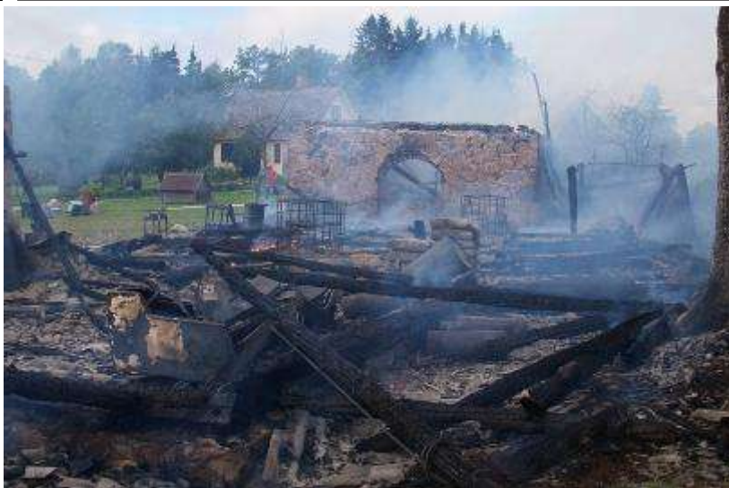
Фото с пожара 31 июля в деревне Ортума волости Вастселийна. В здании находилось 100 цыплят, около половины погибло в огне.

Выру. На ул. Вилья разбили мигалку оранжевого цвета на тракторе, стекло дверцы автомобиля Вольво и сидение мини грузоподъемника.