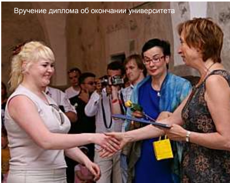
Вручение диплома об окончании университета

По словам Лукаса, снижение численности молодых людей студенческого возраста в определенной степени могут компенсировать люди, которые получают второе и третье высшее образование, однако этого недостаточно. Он добавил, что при общем сокращении численности студентов может увеличиться количество молодежи, которая будет обучаться в вузах на оплачиваемых государством местах.