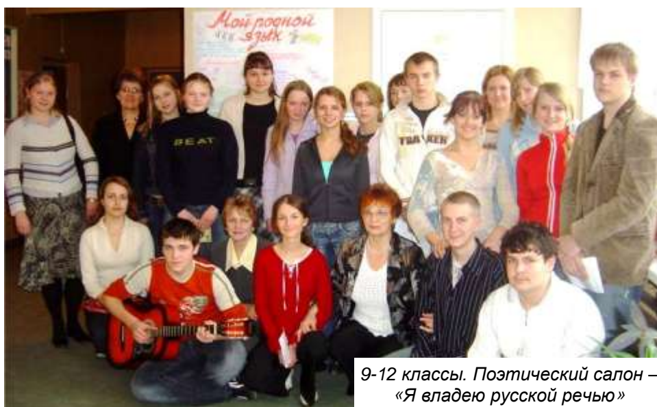
9-12 классы. Поэтический салон – «Я владею русской речью»