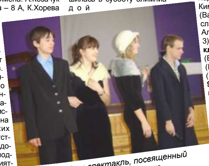
9 классы. Урок-спектакль, посвященный произведениям Михаила Зоценко