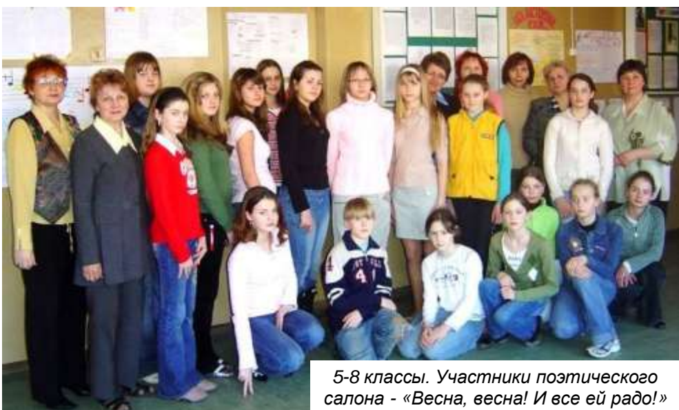
5-8 классы. Участники поэтического салона – «Весна, весна! И все ей радо!»