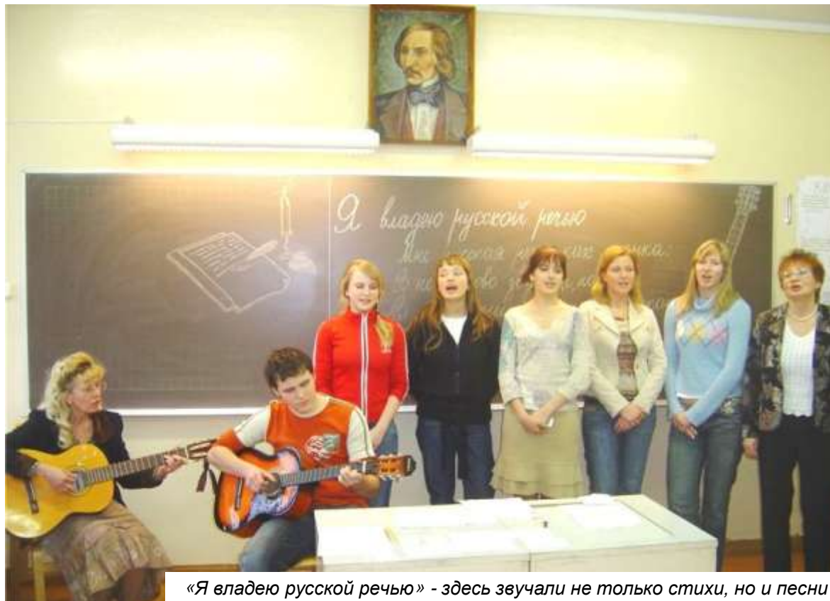
«Я владею русской речью» - здесь звучали не только стихи, но и песни

Неделя русского языка завершилась в субботу олимпиадой