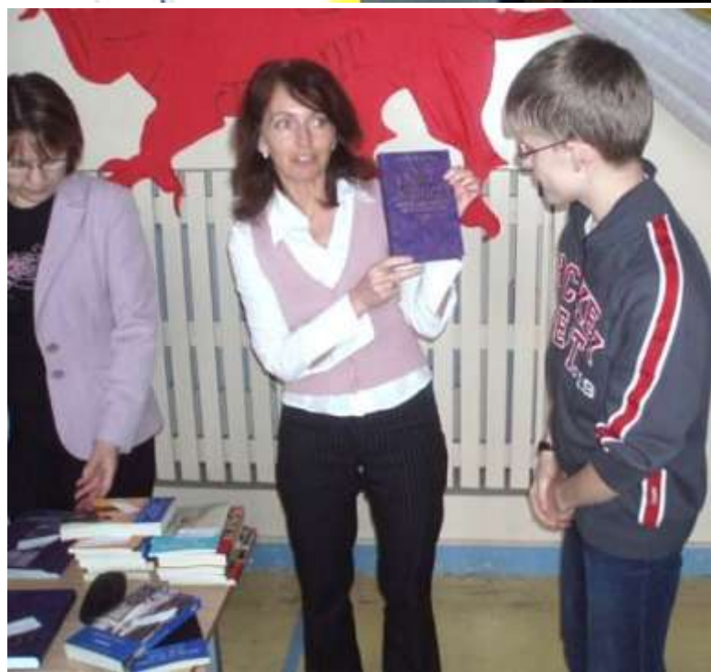
День английского языка