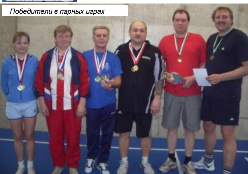
Победители в парных играх