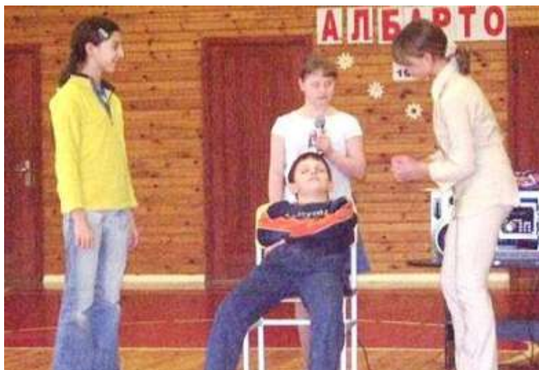
Праздник, посвященный Агнии Барто