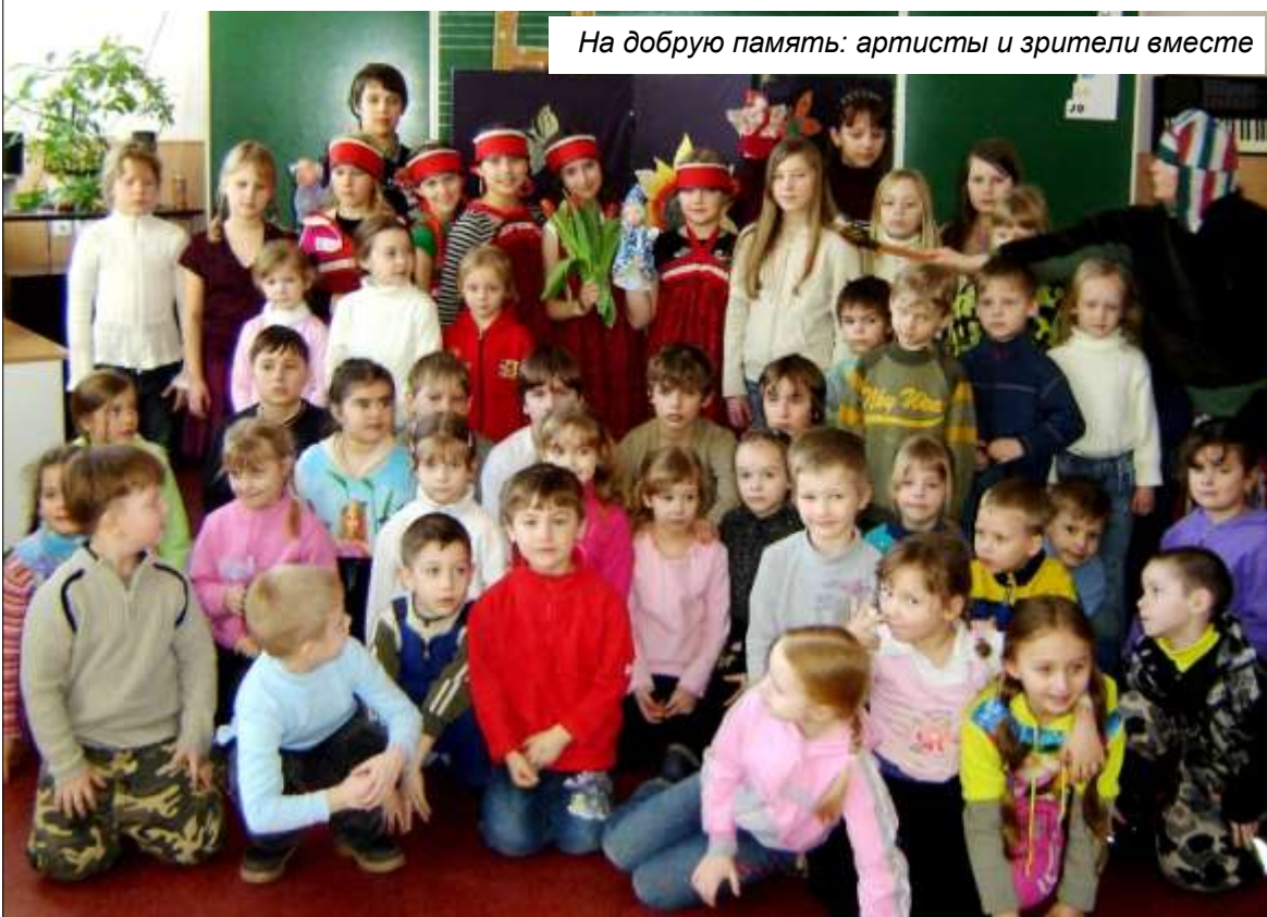
На добрую память: артисты и зрители вместе

зался конкурс инсценировок. Каждая команда получила какую-то легенду. 20 минут на подготовку, 5 – на само выступление, а жанр можно было выбрать любой. Лучший спектакль показала команда из Отепя. Валгаская гимназия спела лучшую песню. Тыврасцы сочинили лимерикс (лимерикс – особый жанр английской абсурдной поэзии, в чем-то родственной русским частушкам).